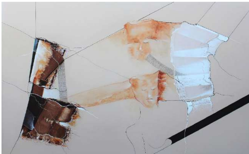
PERCURSOS INTERIORES I Técnica mista sobre tela 90 x 140 cm