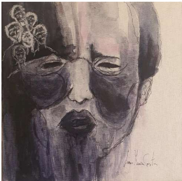
"A invasão ruidosa da mente" Técnica mista sobre tela 30 x 30 cm