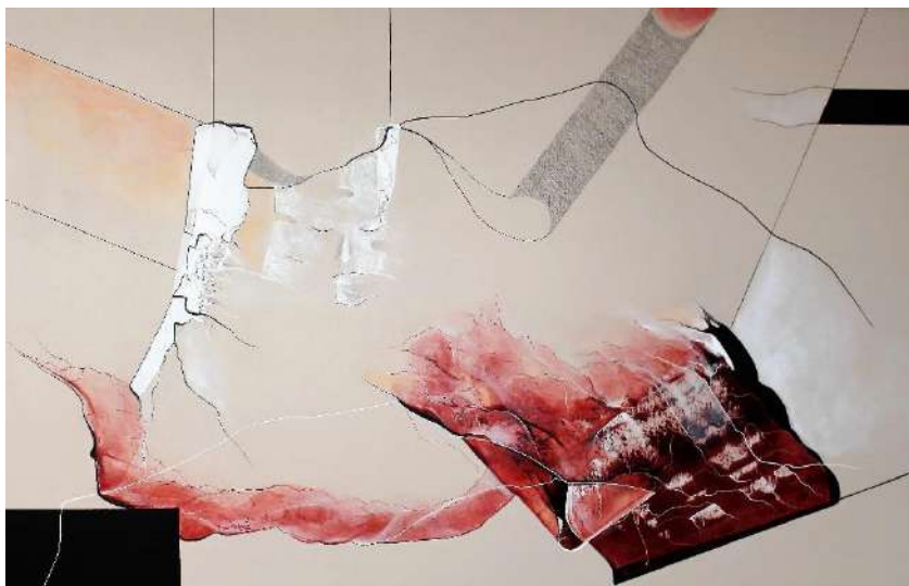
PERCURSOS INTERIORES II Técnica mista sobre tela 90 x 140 cm