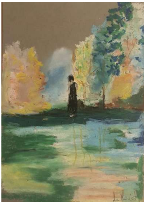
"Do subconsciente ao inconsciente" Pastel de óleo sobre papel 21 x 15 cm